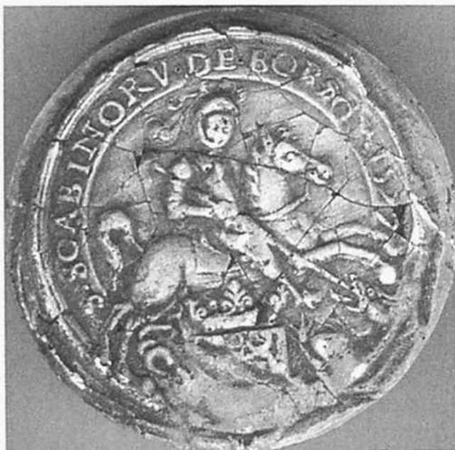
Afgietsel van het zegel van de schepbank van Boorseme uit 1777 (Rijksarchief Hasselt, Verzameling zegelafgietsels , nr. 630)

familiewapen wordt het beschreven als van lazuur, met een adelaar van zilver . In Rekem is het wapen met dit hartschild te zien op de gedenksteen voor Ferdinand d'Aspremont Lynden en Elisabeth de Furstemberg uit 1662 3 . In het wapen dat in 1937 aan de gemeente Rekem verleend werd, is dit hartschild vervangen door een hartschild van keel met een kruis van goud 4 .