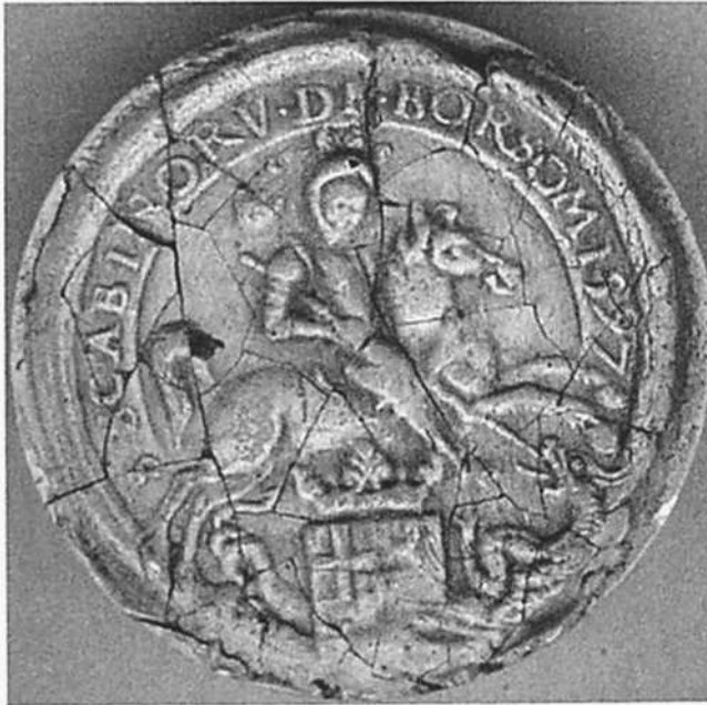
Afgietsel van het zegel van de schepenbank van Boorseme uit 1782 (Rijksarchief Hasselt, Verzameling zegelafgietsels , nr. 1531)

komen 6 . Aangezien op deze afdrucken niet te zien is wat er op het hartschild staat, moet de tekening in het werk van pater Verbois voorlopig beschouwd worden als een artist's impression , eerder dan als een getrouwe weergave van alle details van het zegel. Tot dat een meer volledige afdruk van het schepenbankzegel aangetroffen zal worden, blijft het onzeker wat er precies op het hartschildje afgebeeld wordt.